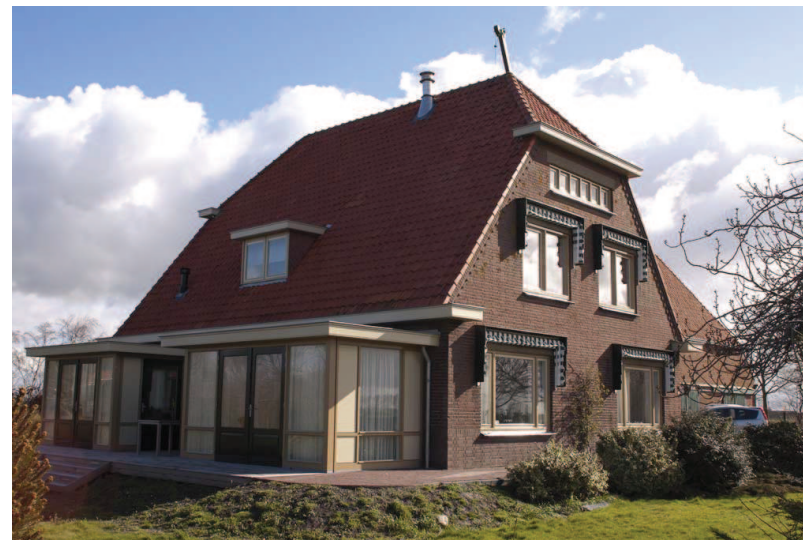
Woning met karakter.

Renovatie en uitbreiding van vrijstaande villa. "Tot op het bot gestript", maar ook weer opgebouwd: volledige nieuw installatie (domotica, aardwarmte, ect.), betonvloeren, badkamer, keuken, interieur, teak houten maatwerk kasten, teakhouten vloeren, uitbreiding d.m.v. serres, schilderwerk, ect. Dit in samenwerking met Saman Installateurs, Geluk Schilders, Van Den Dongen Parket en Bas+Mar de Jager. Eindresultaat? Top!